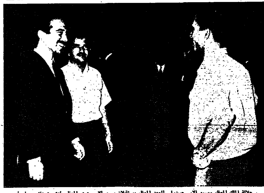
جلالة الملك العظيم وسمو الأمير حسن ولي العهد العظيم يستقلان سمو الأمير محمد لى عودته مساء أمس من بريطانيا

زار الحسين الأغوار الشمالية والمطمان على احوال المواطنين عمان - واد - قام جلالة الملك الحسين العظيم بزيارة مفاجئة الى الشونة الشمالية، حيث نفذ احوال المواطنين وشؤون الزراعة هناك. وقد أمضى جلالة بعض الوقت في مديرية قضاء الأغوار الشمالية وزار قسم الشرطة . وبحث جلالة الملك العظيم مع المسؤولين هناك الشؤون العامة في المنطقة واطمان على سير العمل واهوال المواطنين فيها.